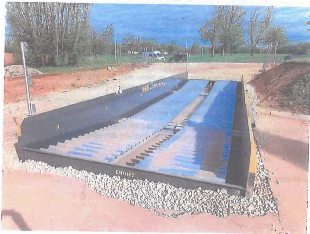
Exemple de Lave-Roue